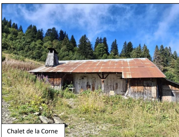
Chalet de la Corne

L'alpage de la Corne comprend d'un chalet. C'est un bâtiment ancien hors d'eau, sans commodité mais utilisable pour stockage et abri temporaire.