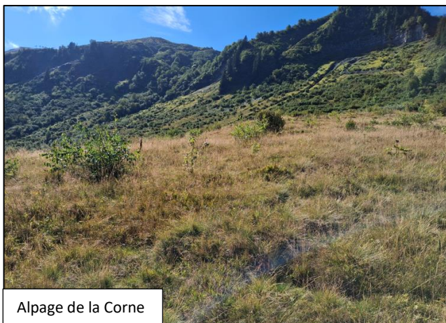
Alpage de la Corne