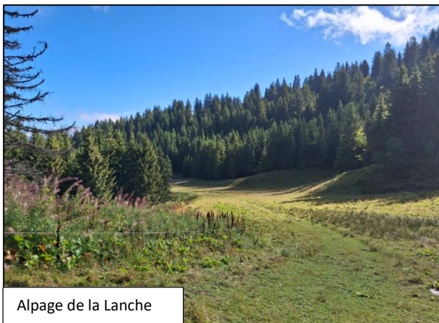
Alpage de la Lanche