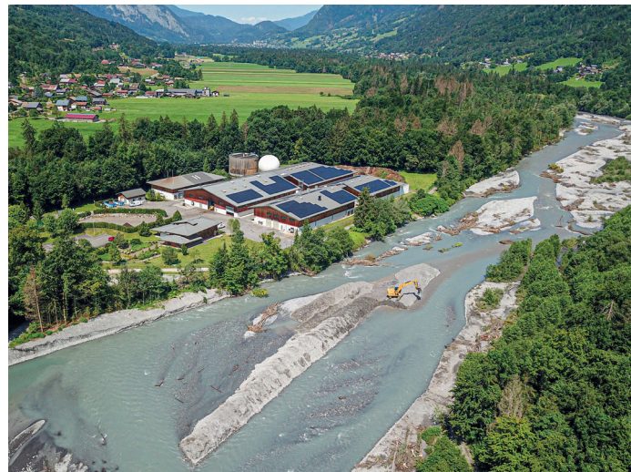
Station d'épuration à Morillon gérée par le Syndicat intercommunal des Montagnes du Giffre (SIMG) jusqu'au 31 décembre 2025

D'un point de vue réglementaire, deux régies intercommunales, l'une pour l'eau potable, l'autre pour l'assainissement, avec deux budgets et des statuts ad hoc, ont été créés à l'automne dernier par la Communauté de Communes. Par ailleurs, les règlements de service sur l'eau potable et l'assainissement, dont les rôles sont de régir les relations entre l'exploitant du service et les usagers, seront votés lors du conseil communautaire du 7 janvier 2026. Ils s'appliqueront ensuite sur le périmètre des deux régies intercommunales, hors cas de délégation ou de portage par un syndicat intercommunal. Autrement dit, les règlements de service ne concerneront que la commune de Mieussy dans un premier temps. Les règlements adoptés sur les territoires en délégation de service public (Veolia Eau et SAUR) continueront à s'appliquer sur les communes concernées.