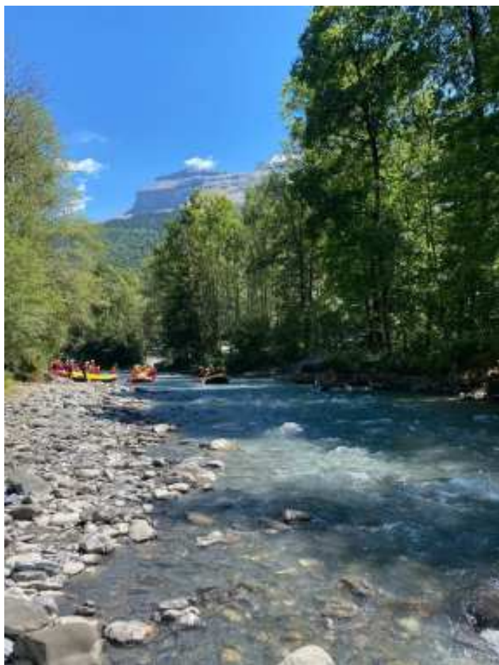
Le Giffre entre Samoëns et Morillon fin juillet